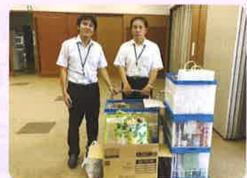
飯田商工会議所女性会