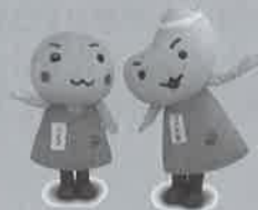
おマメで体操イメージキャラクター マメ太郎・マメ子